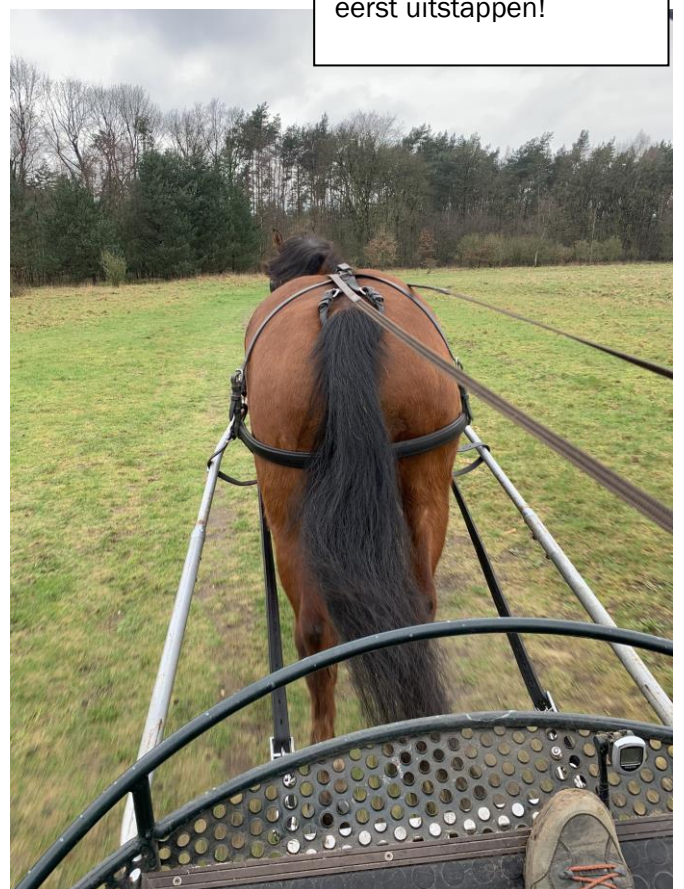
Het uitzicht vanaf de bok!