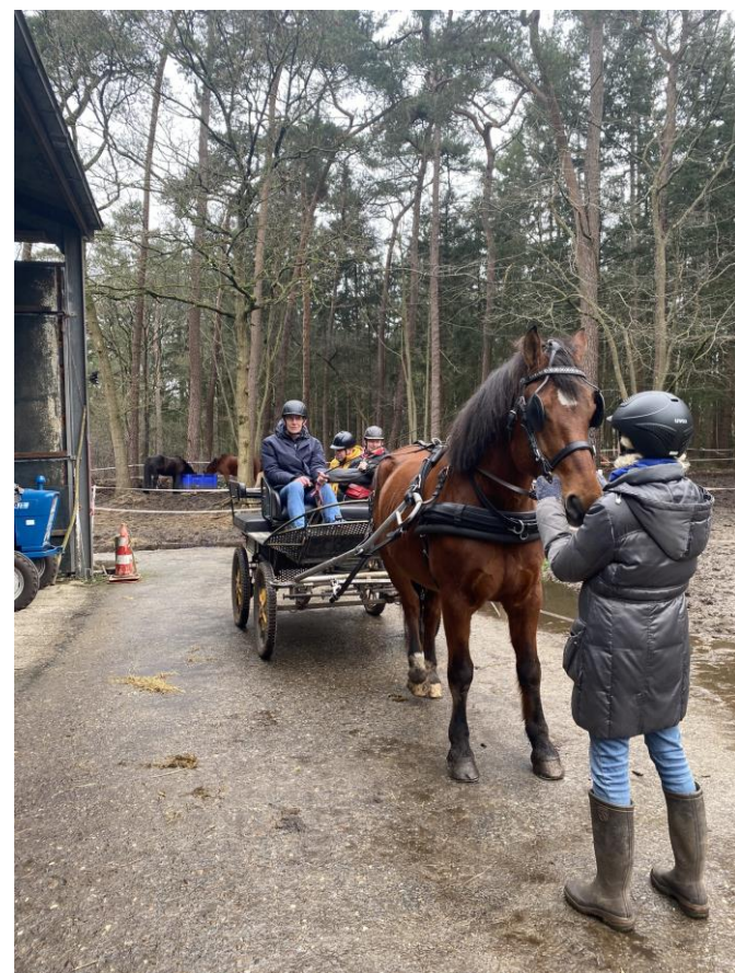
De koets is klaar voor vertrek! De groom houdt het paard nog even vast totdat iedereen goed zit